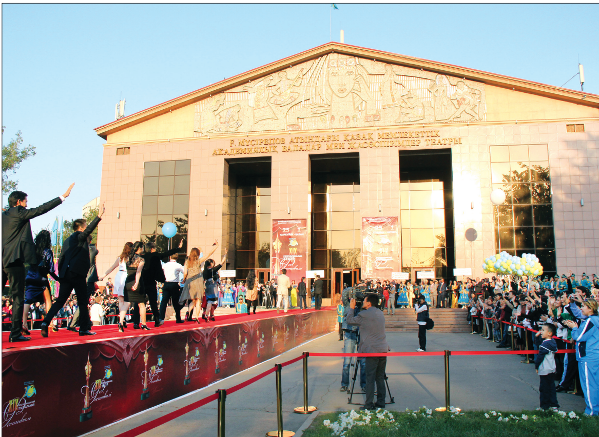
ТЮЗ имени Мусрепова знает и любит каждый алматинец